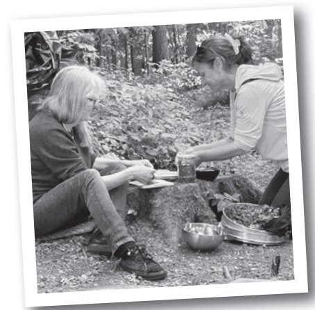
Wildkräuter Spaziergang und Werkstatt

An einem sonnigen Tag fand inmitten des Frühlingswaldes ein spannender Wildpflanzenkurs statt. Unter fachkundiger Führung lernten die Teilnehmenden essbare Wildkräuter kennen und erfuhren viel Wissenswertes über deren Verwendung und Wirkung. Die gesammelten Pflanzen wurden anschliessend zu kleinen kreativen Gerichten verarbeitet und gemeinsam degustiert. Die ruhige und naturnahe Umgebung sorgte dabei für eine besonders angenehme Atmosphäre und viele bereichernde Gespräche.