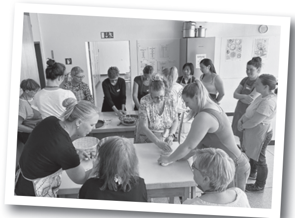
Kochkurs asiatische Teigtaschen

Im April fand unter chinesischer Kursleitung unser Kochkurs «Asiatische Teigtaschen-Triologie» statt. Mit viel Freude, Kreativität und Fingerspitzengefühl wurden verschiedene asiatische Spezialitäten zubereitet. Beim kunstvollen Falten der Teigtaschen zeigten sich zwar unterschiedliche Talente, doch geschmacklich überzeugten die selbstgemachten Köstlichkeiten auf ganzer Linie. In entspannter und geselliger Atmosphäre wurde gekocht, gelacht und rege ausgetauscht. Den gelungenen Kurstag liessen die Teilnehmerinnen bei einem gemeinsamen Essen gemütlich ausklingen.